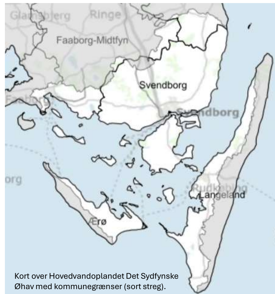
Kort over Hovedvandoplandet Det Sydfynske Øhav med kommunegrænser (sort streg).